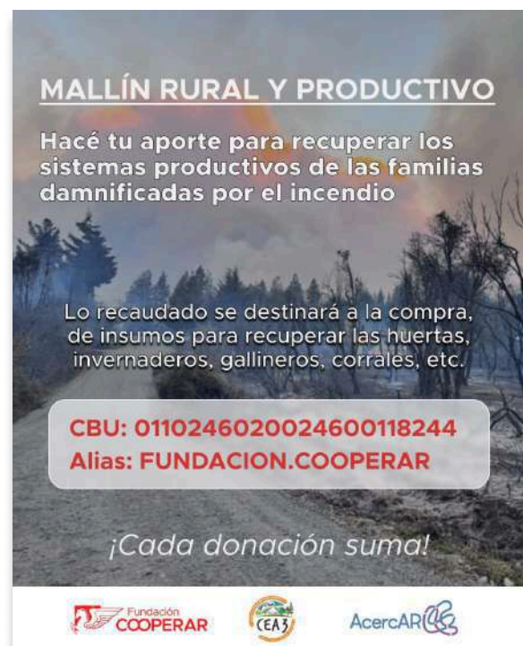
Campaña 3: "Mallin Rural y Productivo" Con CEA 3 y Fundación Cooperar