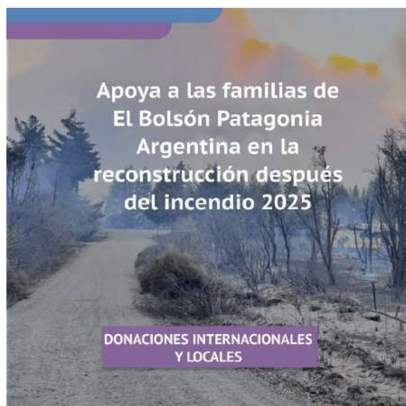
Campaña 2 Reconstrucción: Ayuda a las familias