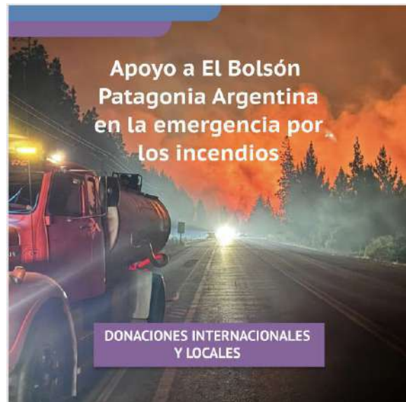
Campaña 1 ayuda a las familias en la emergencia